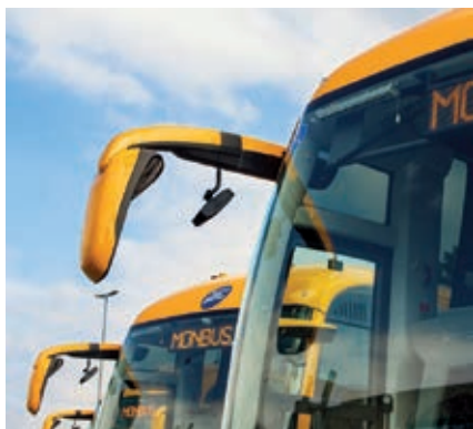
L'Ajuntament d'Esparreguera ha demanat a la Generalitat millores en el servei de transport públic que presta l'empresa Monbus, tant pel que fa a les línies interurbanes com a les urbanes.