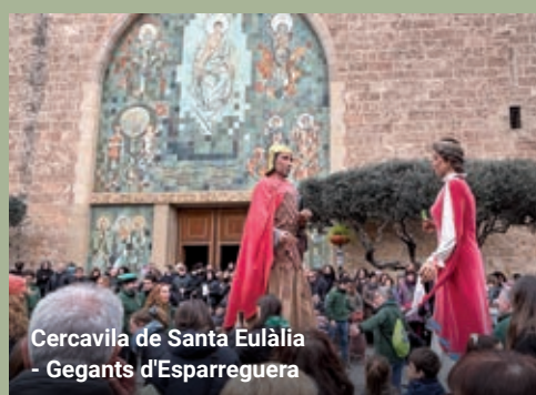
Cercavila de Santa Eulàlia - Gegants d'Esparreguera