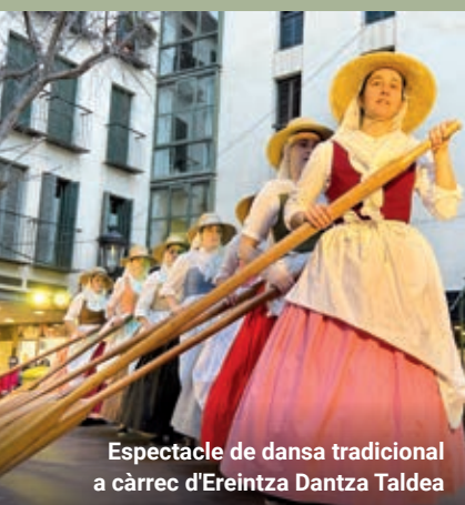
Espectacle de dansa tradicional a càrrec d'Ereintza Dantza Taldea