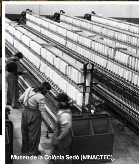
Museu de la Colònia Sedó (MNACTEC)