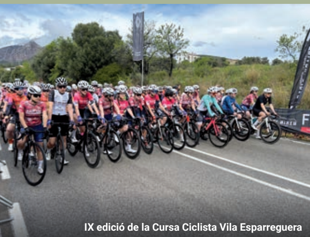
IX edició de la Cursa Ciclista Vila Esparreguera