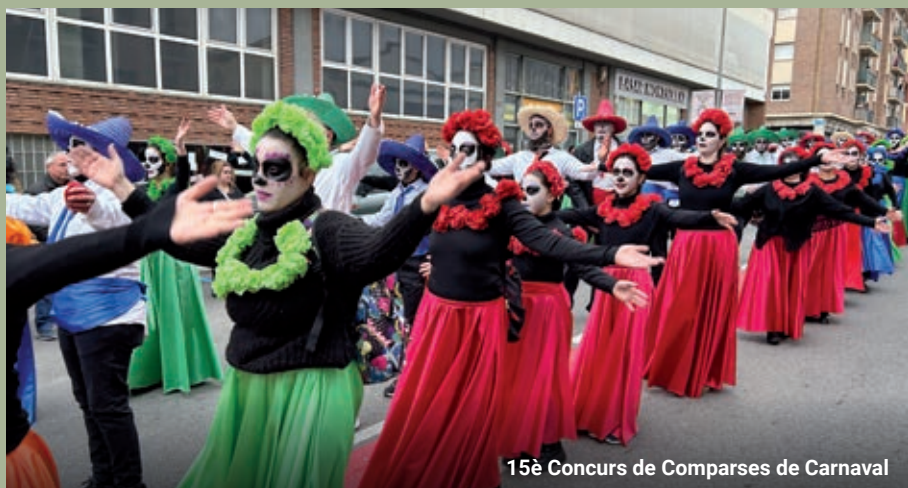
15è Concurs de Comparses de Carnaval