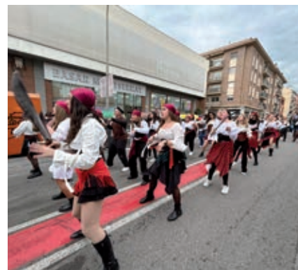
El premi a la millor comparsa ha estat per a «Pirates del Carib», de La Rock Dance Center; el de millor coreografia, per a «El Món de Coco», de l'Escola Montserrat, i el de millor carrossa, per a «Alicia al País de les Meravelles», de l'Escola Mare de Déu de la Muntanya #Esparreguera