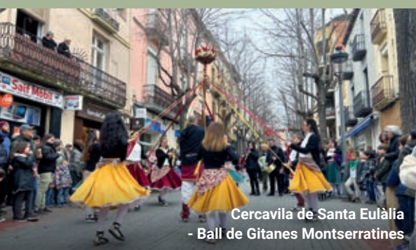
Cercavila de Santa Eulàlia - Ball de Gitanes Montserratines