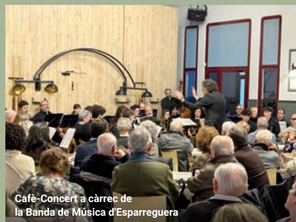
Cafè-Concert a càrrec de la Banda de Música d'Esparreguera