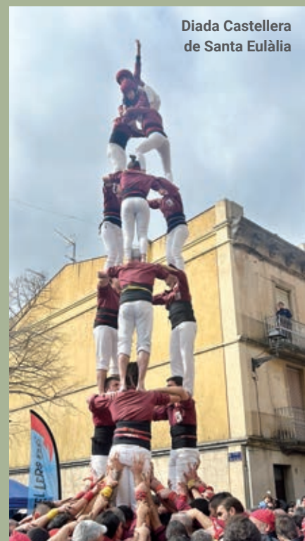
Diada Castellera de Santa Eulàlia