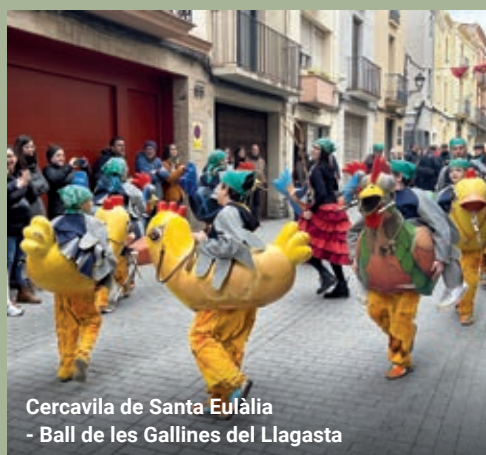
Cercavila de Santa Eulàlia - Ball de les Gallines del Llagasta