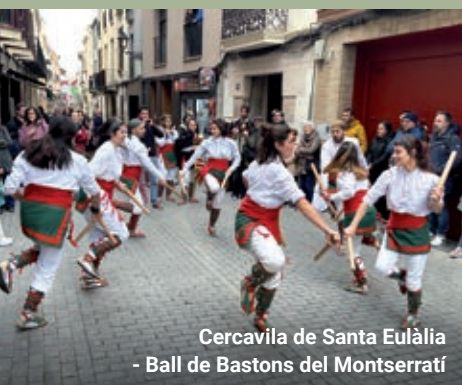
Cercavila de Santa Eulàlia - Ball de Bastons del Montserratí