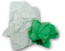
Paper de cuina i tovallons bruts de menjar