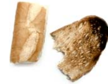
Pa sec i menjar cuinat