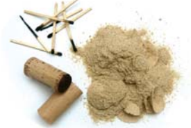
Taps de suro, serradures i llumins