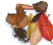
Petites restes de jardineria (rams marcits, fulles, etc.)