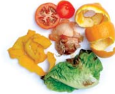
Restes de fruita i verdura