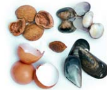
Closques d'ou, fruita seca i marisc