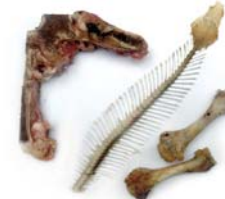
Restes de carn i peix