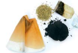
Marro de cafè i restes d'infusions