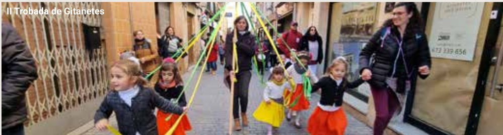
II Trobada de Gitanetes

Pepet i Marieta celebren el seu 20è aniversari amb un xou total, que repassa tots els seus èxits a cop de medley . Tornen els grans clàssics de la banda i s'entrellacen amb el material nou gràcies a medleys temàtics que mantenen el ritme de l'espectacle sempre amunt. El resultat és un clímax imparabile vestit de jocs interactius, sorpreses escèniques i picades d'ullet musicals per a ballar les coses pel seu nom amb un somriure d'orella a orella.