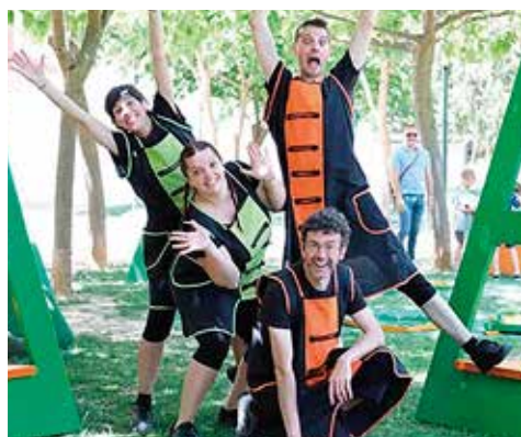
> Cirkomotik - Cia. El Negro y el Flaco

CirkoMotik crea un parc temàtic al voltant del circ pensat per al gaudi de petits i grans. L'espai permet conèixer diferents tècniques del circ, amb tres espais diferenciats: jocs de psicomotricitat, jocs d'equilibri i malabars.