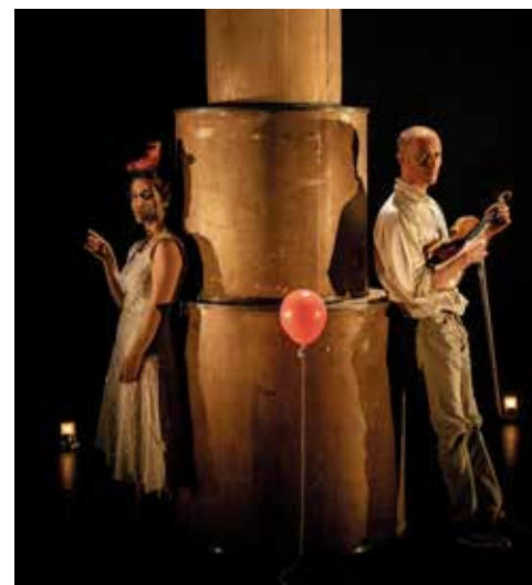
> Petits Prínceps - Cia. Mumusic Circus