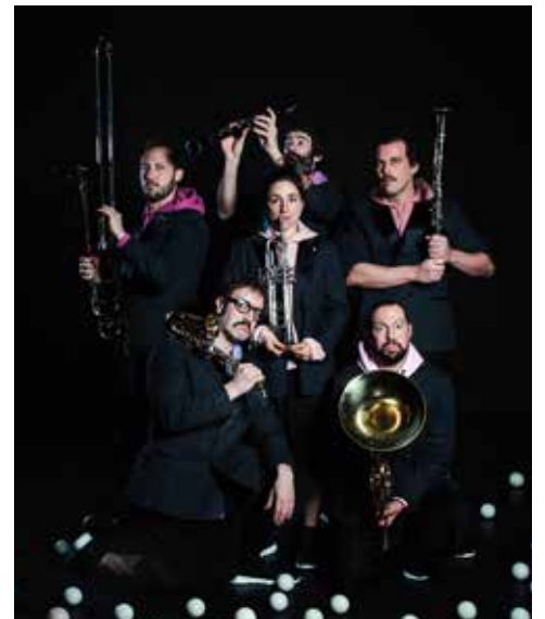
> Orquestra malabars - Cia. Pistacatro

Orquestra de Malabars és un espectacle que posa en escena sis malabaristes i la banda de música de la localitat que visiten, en aquest cas la Banda de Música d'Esparreguera. Les arts del circ ocupen els espais buits entre els faristols i les cadires dels músics per crear un concert on els malabars es converteixen en els ballarins d'un ballet aeri en un diàleg entre música i circ.