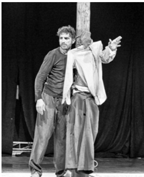
> Mira't - Circ Pànic

A la pista, un home i una gran balança. Jugant amb pesos i contrapesos, l'home emprèn un viatge a la recerca constant dels límits de l'equilibri. Aquest viatge és tant físic com interior. És un mirar-se i també exposar-se a la mirada dels altres. Mirar la pròpia solitud per transcendir-la i exposar-la al bell mig de la pista.