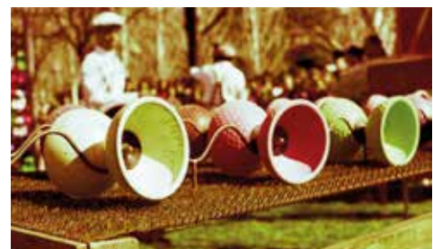
> Circ a les golfes - Cia. Los Herrerita

Quan érem petits vam descobrir que a les golfes, entre maletes, baguls, trastos vells i tota mena d'andròmines, hi havia una col·lecció d'objectes de circ que evidenciaven quin havia estat l'ofici dels avis. Gaudirem de fer de trapezistes, de caminar damunt del fil o sobre l'esfera d'equilibri, d'anar en monocicle i de provar de fer malabars.