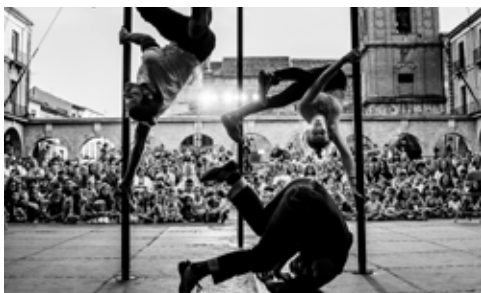
> Entre Nous

Entre Nous es un espectacle de trobades, de companyia, de sostenir-se, de nostàlgia, d'humor, de música en directe i d'acrobàcies vertiginoses en tres perxes xineses. Una invitació a xisclar i a riure davant la necessitat de mirar-se i de compartir aquest moment des del primer fins a l'últim minut.