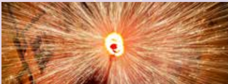
@Diables Esparreguera - EspaiBlanc

En Llagasta, enfurismat, reclama als vilatans les seves gallines i crema tot el poble amb l'ajuda del profeta Hefest i els seus fidels llagastins. L'acte comença amb el correfoc infantil dels Polls Folls amb la comitiva d'en Llagasta i continua amb el correfoc adult. Sobreviu a la ira d'en Llagasta o uneix-te als llagastins!