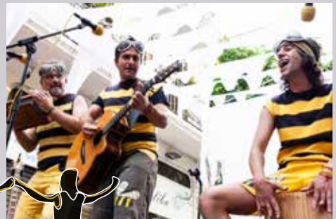
©Zum - La Tresca i la Verdesca

Zum és un espectacle musical d'animació amb cançons i danses adreçat al públic familiar. La Tresca pretén que l'acció passi fora de l'escenari, de manera que es faci protagonista la gent que assisteix a l'espectacle.